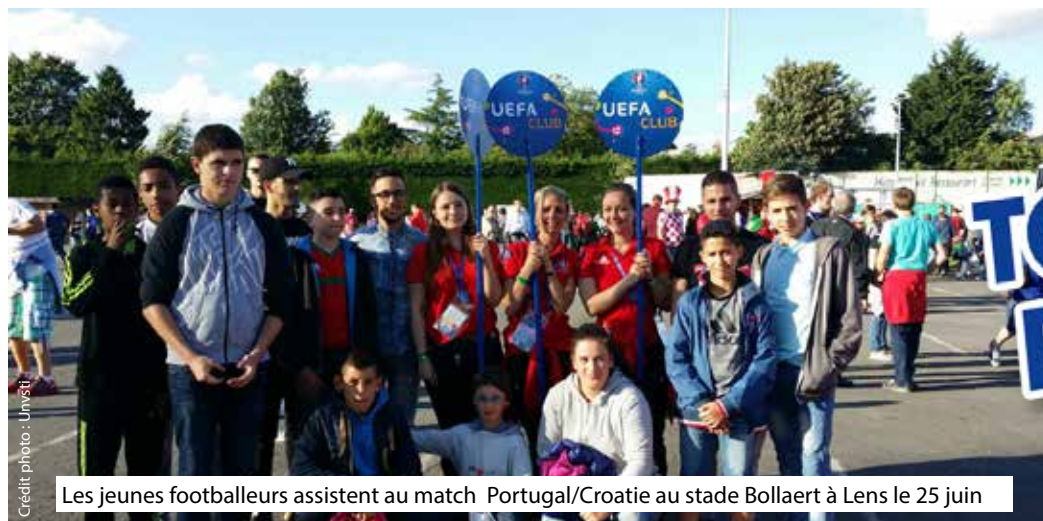
Les jeunes footballeurs assistent au match Portugal/Croatie au stade Bollaert à Lens le 25 juin