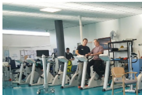
Hôpital de Saint-Brieuc Bilan sportif