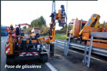
Pose de glissières