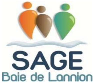
Schéma d'Aménagement et de Gestion des Eaux de la Baie de Lannion