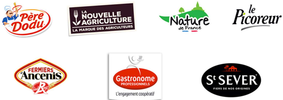
Figure 2 : Les marques GALLIANCE

Le groupe GALLIANCE appartient au groupe TERRENA, 2 ème groupe coopératif français, qui a réalisé 5,1 milliard d'euros de chiffre d'affaires en 2017.