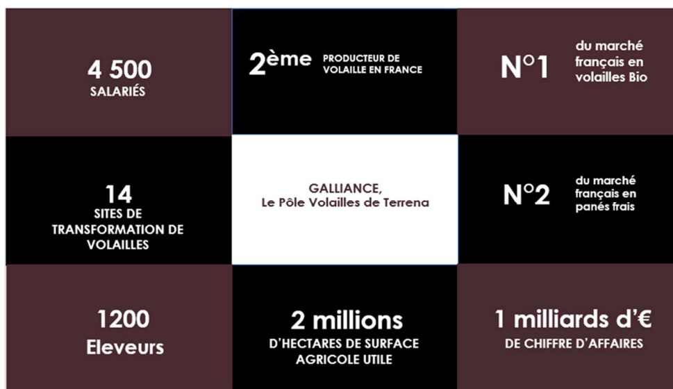
Figure 4 : Les chiffres clés de Galliance

4 unités budgétaires (BU's) composent Galliance :