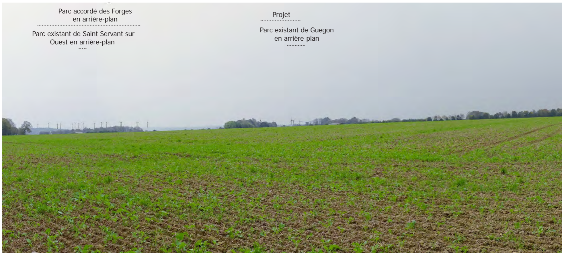
Photomontage 45 depuis la RD1 au Nord de La Trinité-Porhoët - Exemple de vue plus proche depuis le Nord (à environ 6 km du projet)

Les vues depuis le Nord sont aussi illustrées par le photomontage 32 près de Plumieux (cf. partie relative aux bourgs ci-après), et par le photomontage 45 depuis la RD1 au Nord de la Trinité-Porhoët.