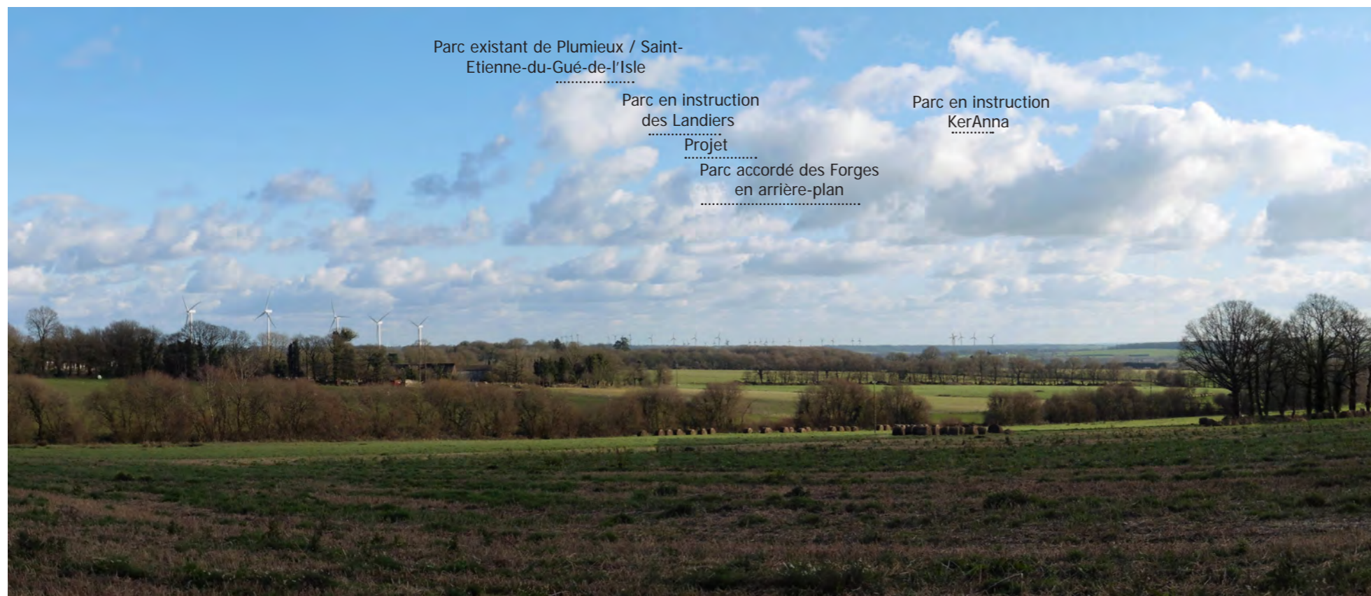
Photomontage 42 près de Loudéac - Exemple de vue lointaine depuis le Nord (à environ 14 km du projet)

A l'échelle éloignée, le projet s'inscrit dans des vues comprenant déjà des parcs plus lointains (exemples des photomontages n°35, 36, 42).